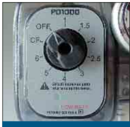
Wahlschalter und Warnanzeigen